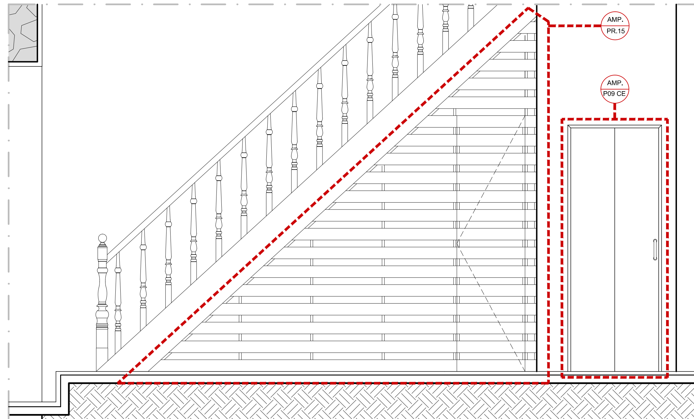
02 DETALHE DAS ÁREAS MOLHADAS - VISTA 09 ESCALA 1:20